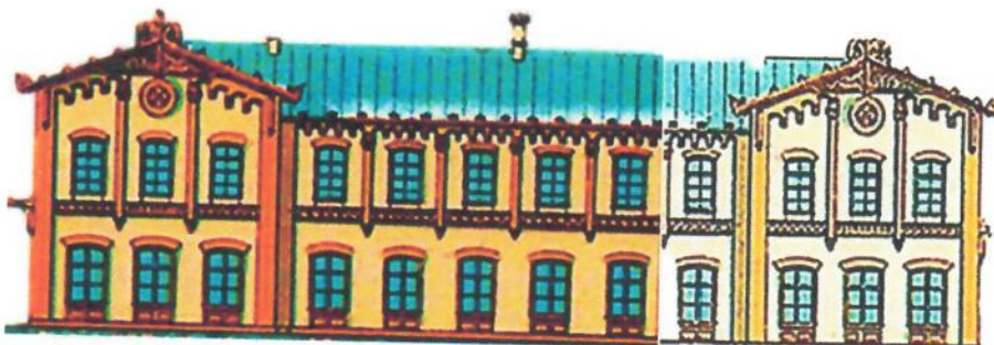
Kompilacja fragmentów poprzedniej ilustracji. Dworzec z dobudowanym w latach 1892–1893 skrzydłem północnym (jaśniejszy kolor)