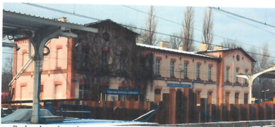
Budynek zachował się w niezmienionym kształcie (fot. z 2017 r.)