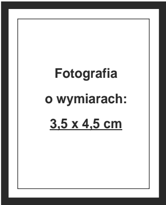
(nie wykracza poza ramki wewnętrzne)

Ja, niżej podpisany, uprzedzony o odpowiedzialność karnej za zeznanie nieprawdy lub zatajenie prawdy (art. 233 § 1 k.k.) oświadczam, że moje miejsce zamieszkania znajduje się na terytorium Rzeczypospolitej Polskiej, przy czym (zaznacz włączyć kwadraty liter „X”):