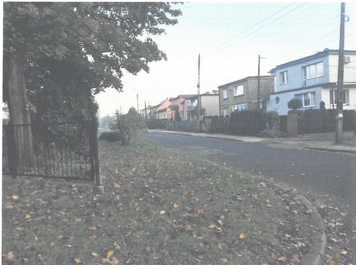
domy przy ul. Floruskiej (dzieli od ziomoniske droge/ulice)